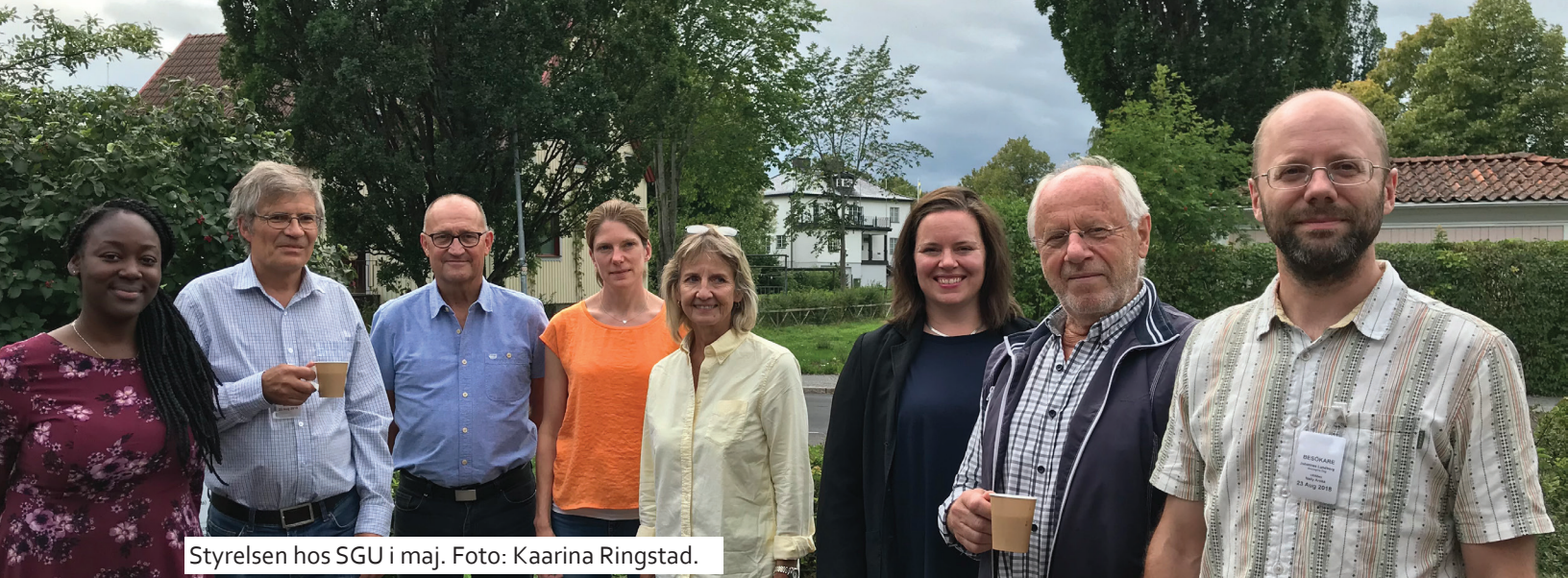
Styrelsen hos SGU i maj.