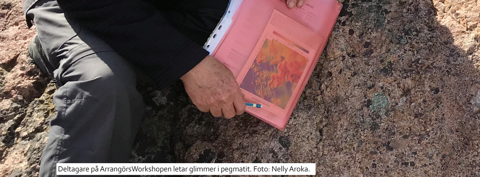
Deltagare på ArrangörsWorkshopen letar glimmer i pegmatit.