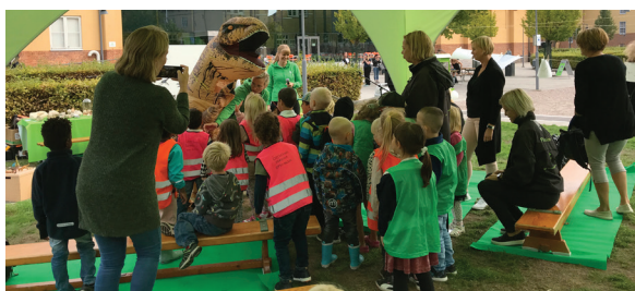
Dinosaurie på invigningen.

Högskolan i Kristianstad höll i invigningen den 7 september. Dagen gick i paleontologins tecken. Dinosaurier och fossiletning lockade.