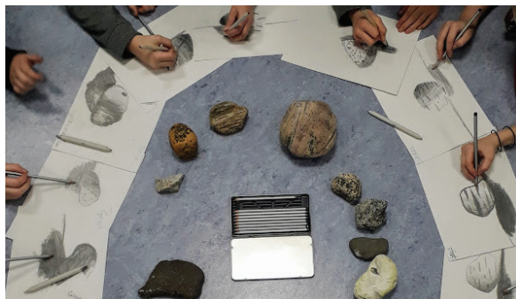
Vinnaren av Fototävlingen: Västra Karups skola.

Vi har nedladdningsbara lektioner, lärarpaket för beställning och skoltävlingar. Allt vårt lärarmaterial är gratis.