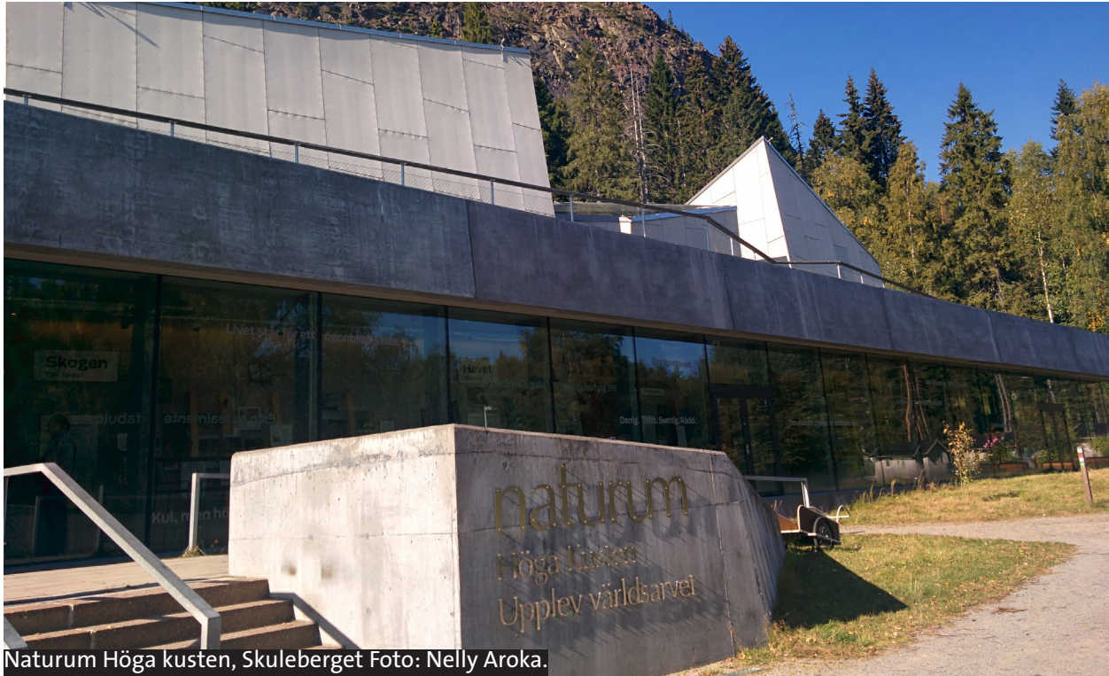
Naturum Höga kusten, Skuleberget Foto: Nelly Aroka.