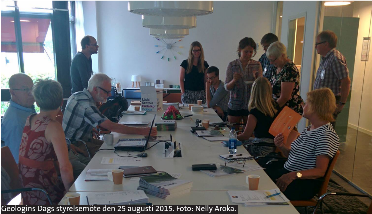
Geologins Dags styrelsemöte den 25 augusti 2015.