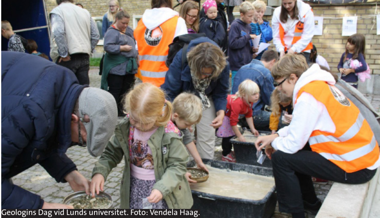
Geologins Dag vid Lunds universitet.