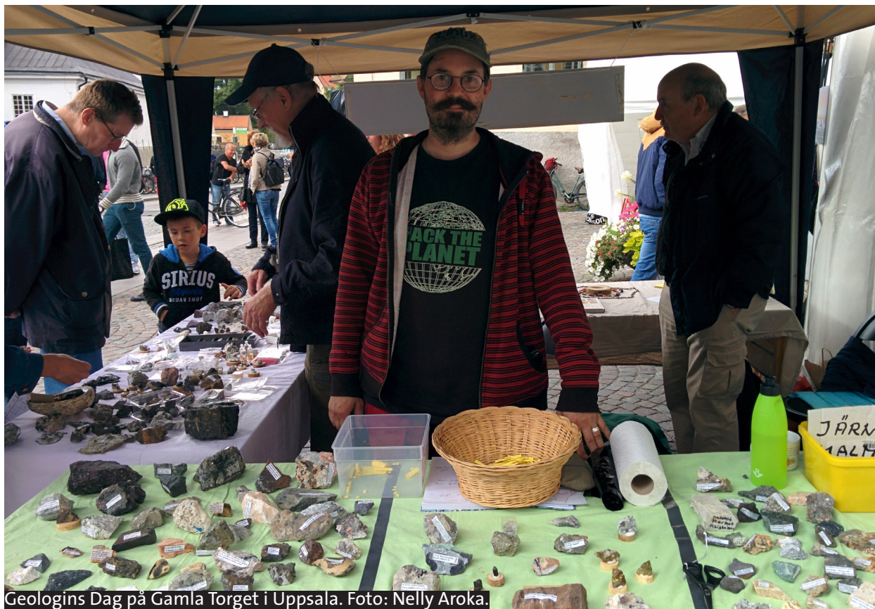
Geologins Dag på Gamla Torget i Uppsala.