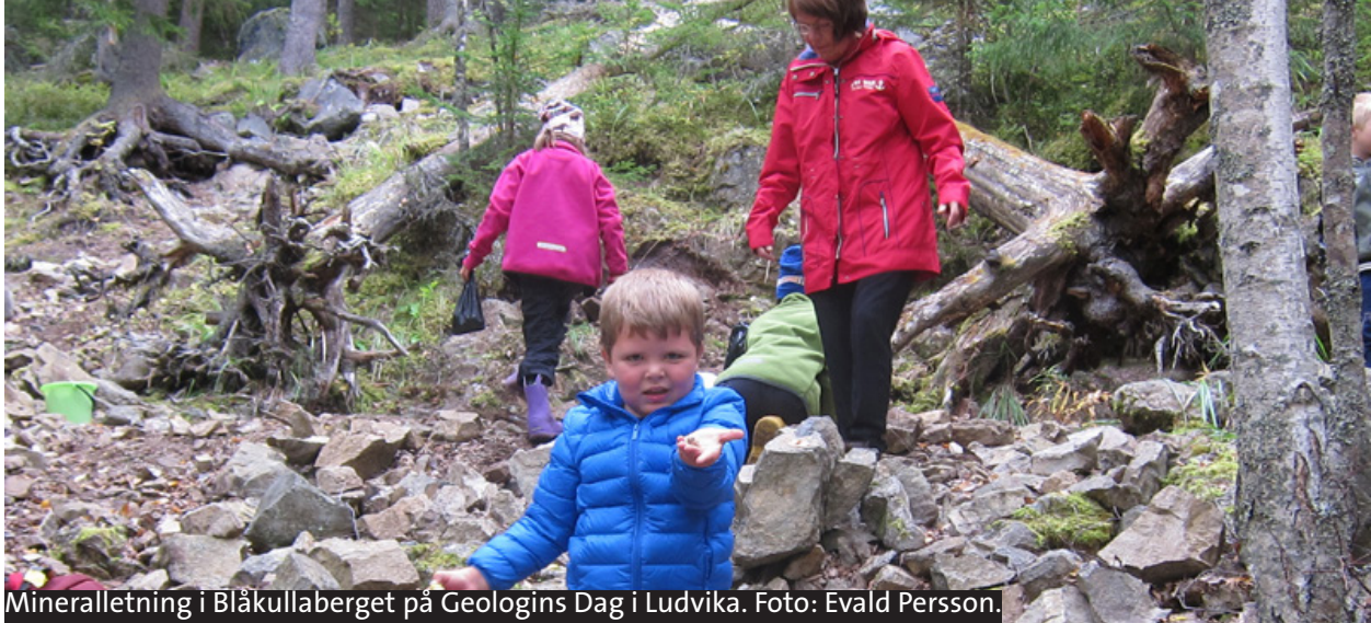
Mineralletning i Blåkullaberget på Geologins Dag i Ludvika.