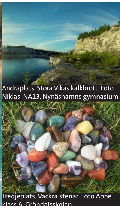
Andraplats, Stora Vikas kalkbrott.