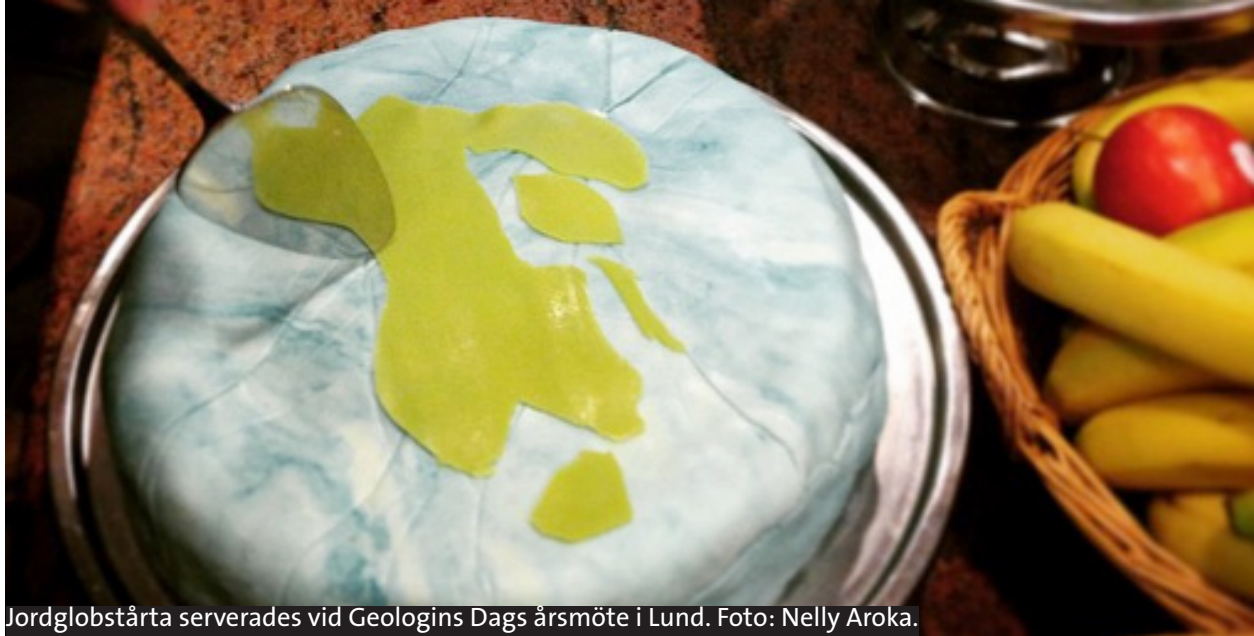
Jordglobstårta serverades vid Geologins Dags årsmöte i Lund.