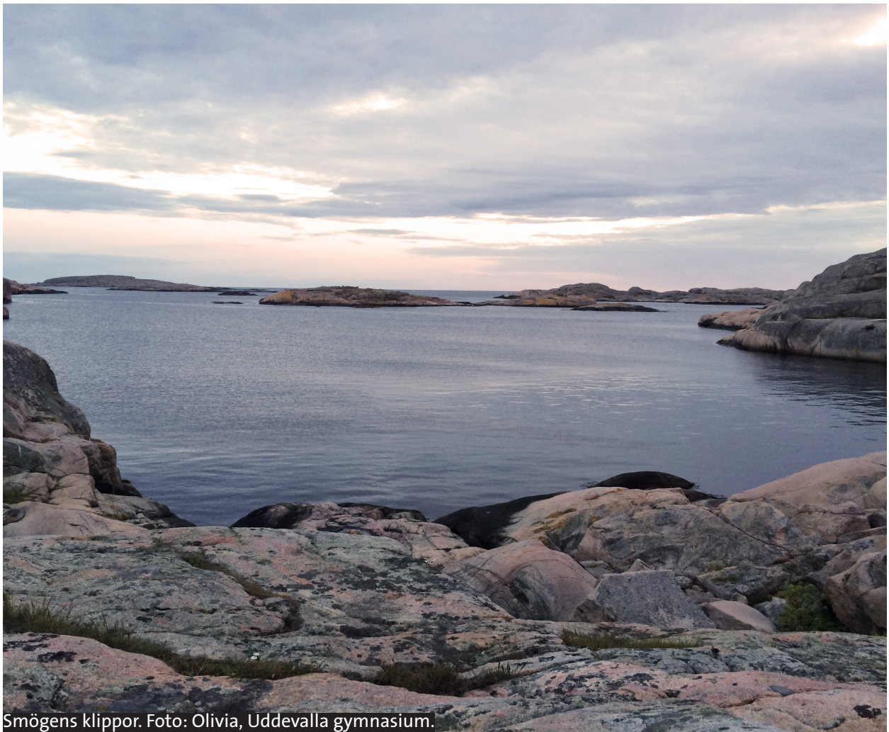
Smögens klippor.

Lista på alla arrangemang 2015 Styrelsen för geologins dag 2015 Mer om geologins dag