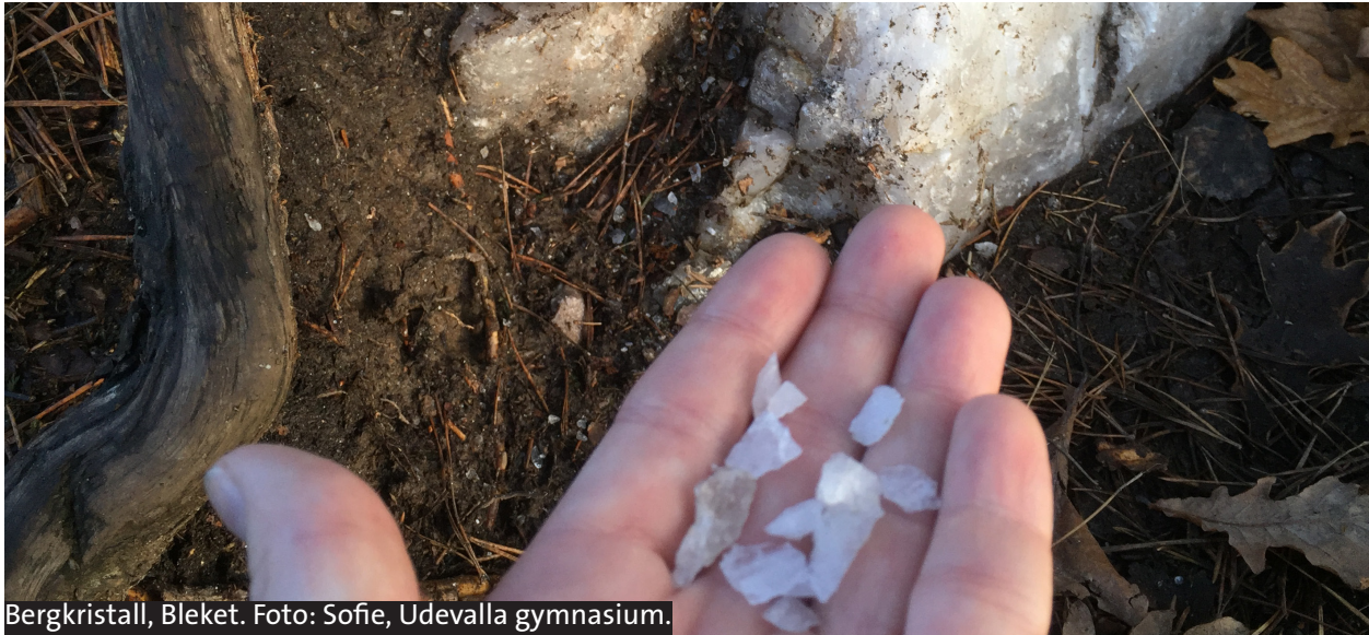
Bergkristall, Bleket.