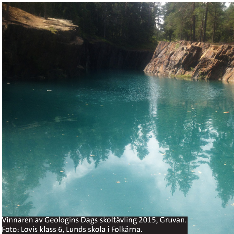
Vinnaren av Geologins Dags skoltävling 2015, Gruvan.