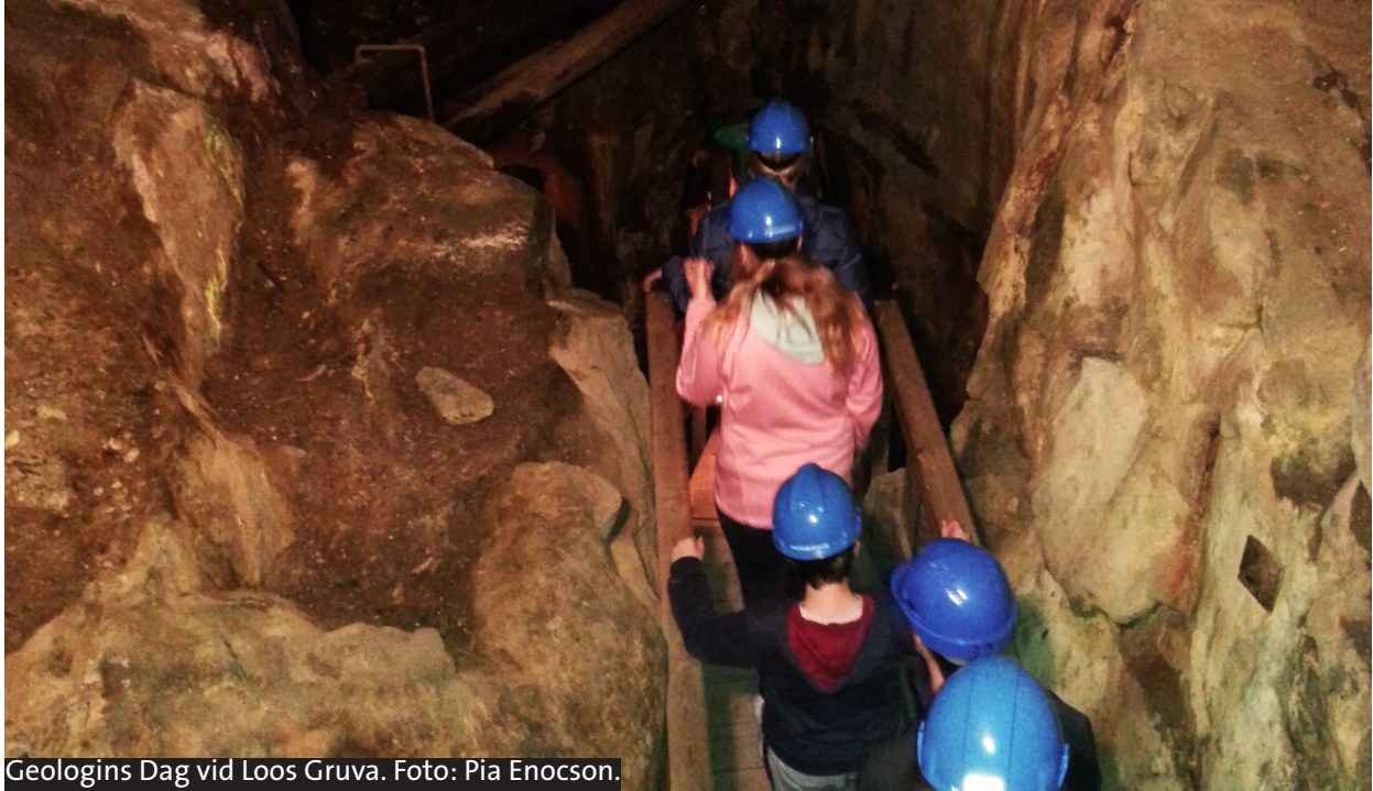
Geologins Dag vid Loos Gruva.