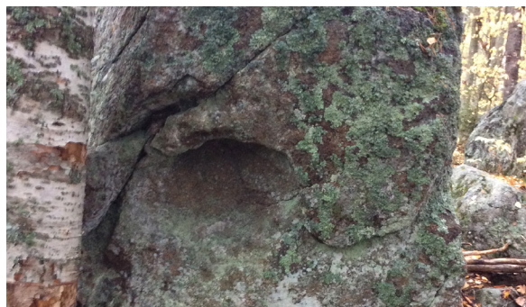
Vinnaren av fototävlingen: Hansåkerskolan.

Vi erbjuder kostnadsfria nedladdningsbara lektioner och informationsmaterial såsom broschyrer och affischer.