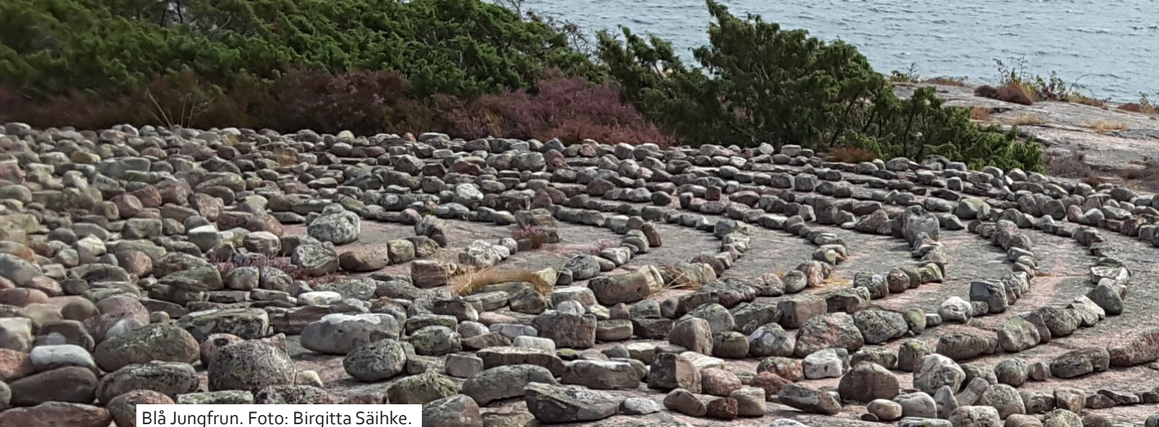
Blå Jungfrun.