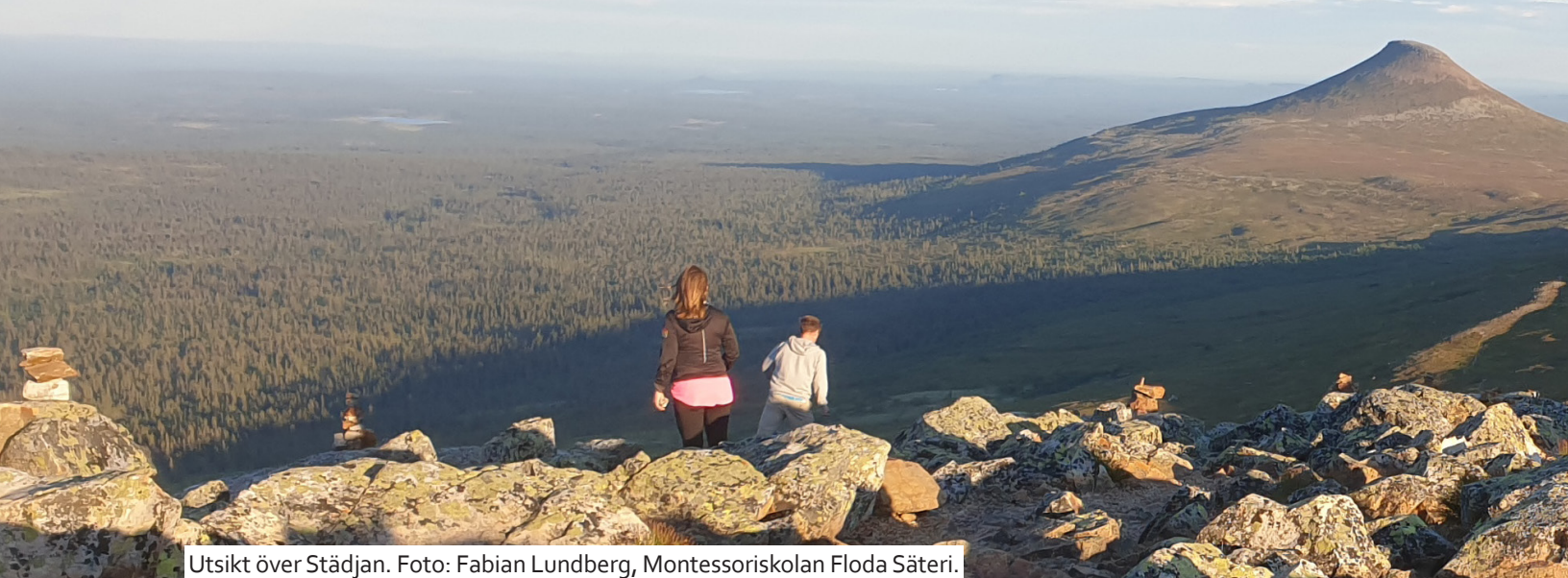
Utsikt över Stådjan.